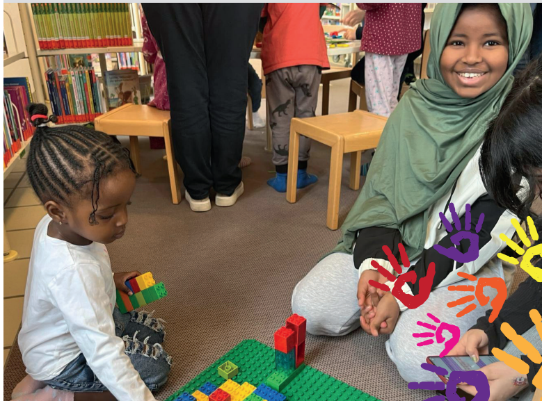
MITEINANDER IN KARLSTEIN