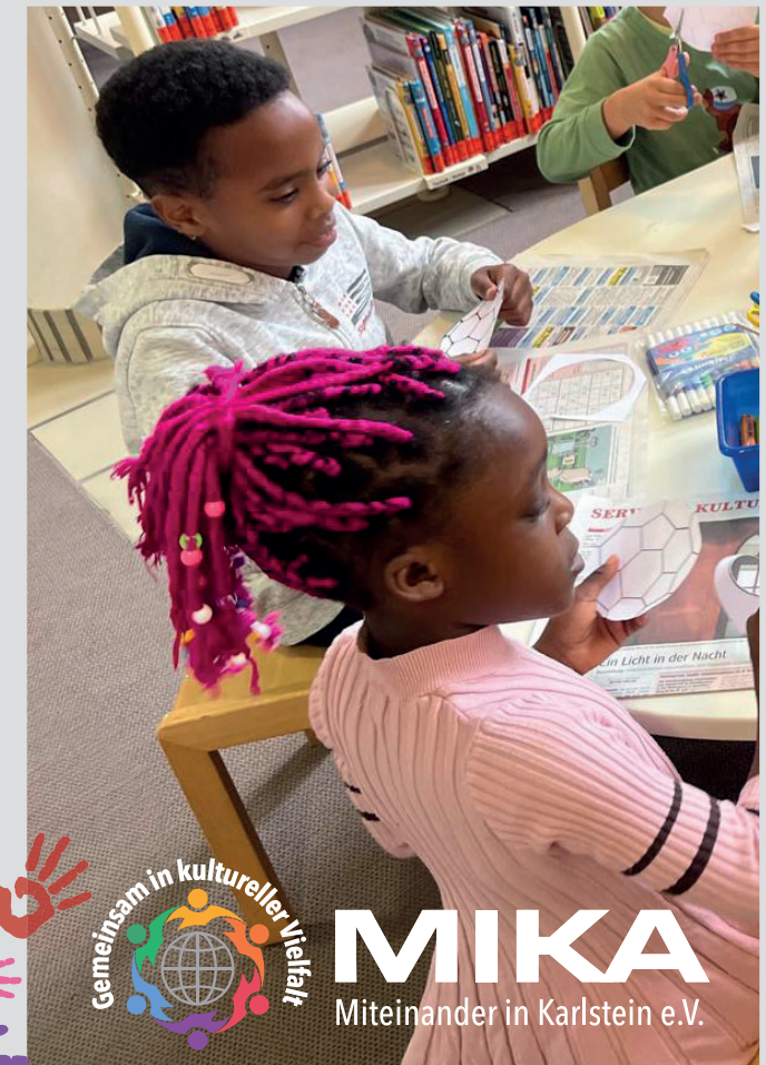
MITEINANDER IN KARLSTEIN