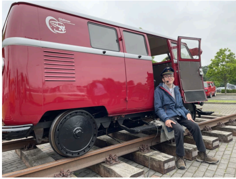
Beim "Bulli&Coffee"-Event in Hannover im Juni 2024.